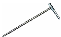
2x sonda 30 cm do wbijania w grunt