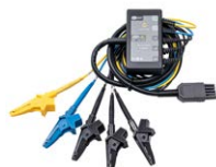
Adapter AutoISO-1000C do automatycznego pomiaru rezystancji izolacji przewodów wielożyłowych