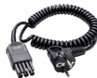
Adapter WS-04 (wtyk kątowy UNI-Schuko)