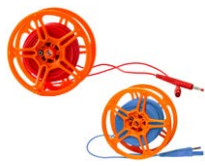
Przewód pomiarowy na szpuli do pomiaru uziemień 25 m czerwony / niebieski