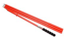
Sonda ostrzowa czerwona 1 kV (2 m rozkładana, gn. bananowe)