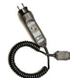
Adapter WS-03 wyzwalający pomiar (wtyk UNI-Schuko)