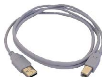
Przewód interfejsu USB