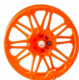
Szpula do nawinięcia przewodu pomiarowego